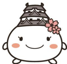
姫路市キャラクター しろまるひめ

持続可能な開発のための実施手段を強化し、グローバル・パートナーシップを活性化できるよう努めていきます。